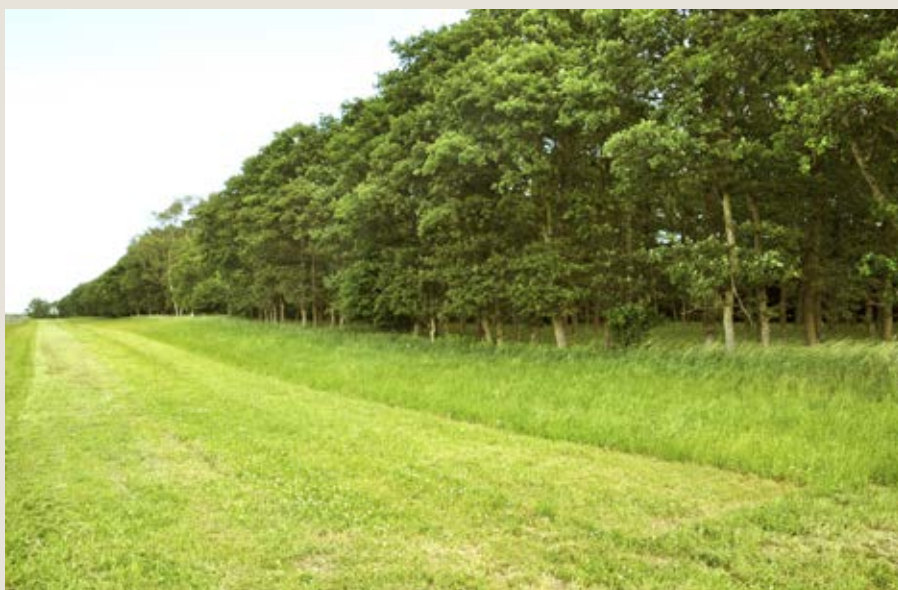
Op mod skovbrynet er anlagt en vildtager med kløvergræs. Der slås 1/3 hver uge for at sikre en god genvækst. Bemærk hvordan egene er bidt op nedefra af dyrene.