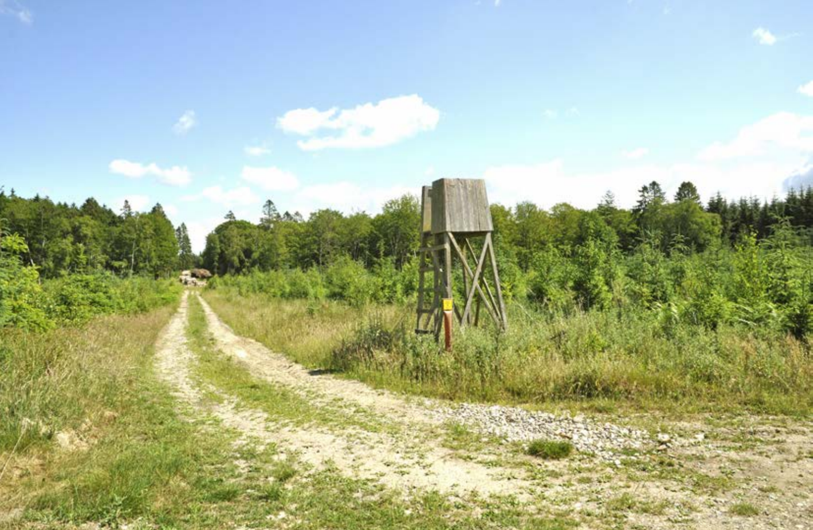
Skydetårn på en stor flade med kulturer i alle retninger – dette tårn er en sikker post. (Den røde pæl markerer en højspændingsledning).

inkludere fælles målsætninger for afskydning, jagt afvikling, forstyrrelse og alders-/kønfordeling.